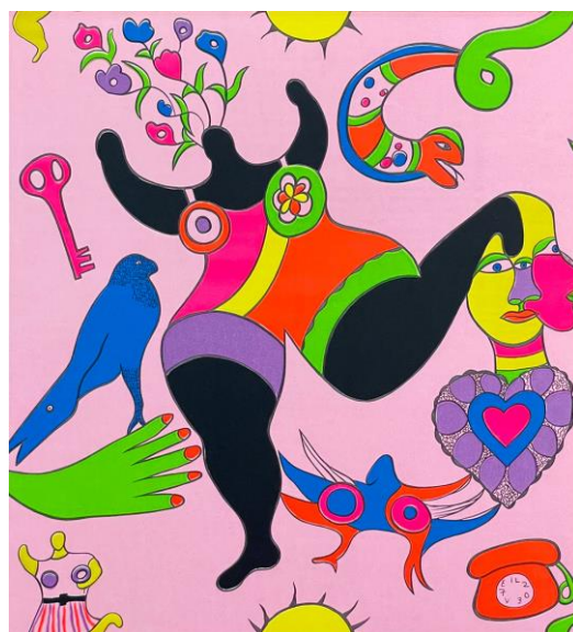
Niki de St. Phalle