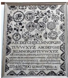
(merklap An Boonen)

Zie ook informatie op bladzijde 20 van dit jaarboekje