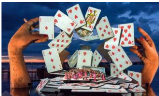
(Bregenzer Festspiele 2018)

Betaling vóór de eerste bridgemiddag op 20 september 2019 op bankrekening NL55RABO 0144 1416 47 t.n.v. KVG Roermond o.v.v. Bridgeclub