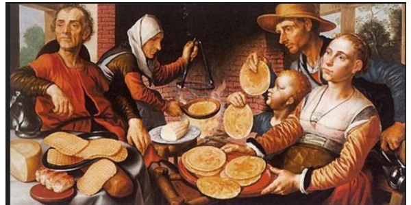
Museum Boijmans van Beuningen